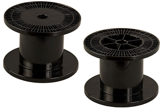
— K 152 / 20 —